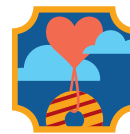
Mi currículum de negocio de galletas