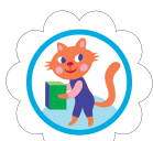
Fijadora de metas de galletas