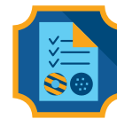
Influencer de galletas