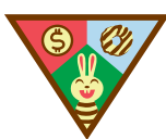
Mis clientes de galletas