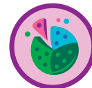
Colaboradora de galletas