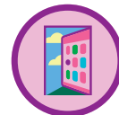
Mi equipo galletero