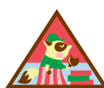
Tomadora de decisiones sobre galletas