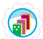
Mi primer negocio de galletas

*Por el momento, sólo las insignias Brownie y Daisy están disponibles en formato bilingüe.